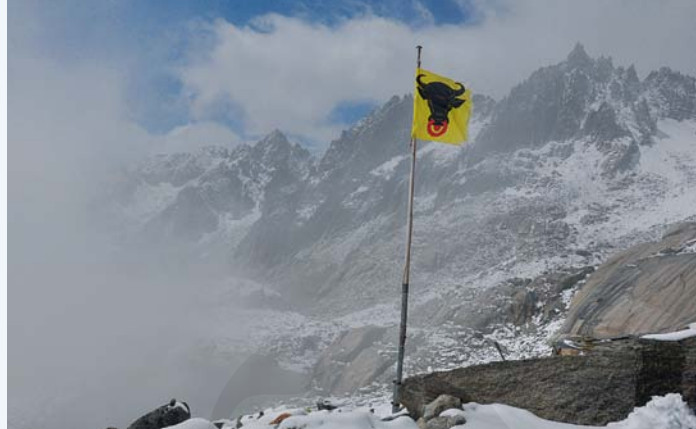
Abb. 2: Uristier mit Klein und Gross Furkahorn