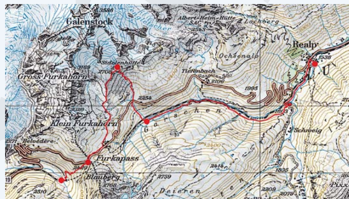
Abb. 4: Routenverlauf