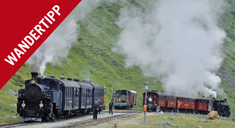
Abb. 1: Kreuzende Dampzüge in der Station Muttbach